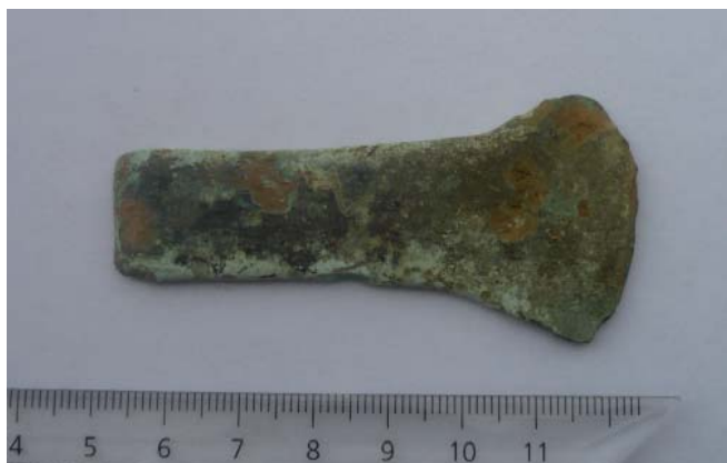
Fig. 2. Foto van de vlakbijl.