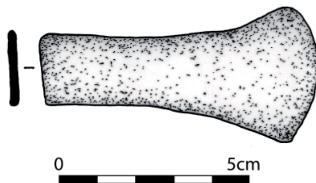
Fig. 3. Aanzicht en doorsnede van de vlakbijl (tekening: Jean-Pierre Parent/Joris Angenon).

de Durme in de omgeving van Lokeren (Verlaeckt 1996:19). Een vondst uit Waasmunster vertoont ook enige verwantschap met het type Bygholm, naast eventuele gelijkenissen met Engelse bijlen (Verlaeckt 1993:180-181; Id. 1996: cat. 215). Een tweede vondst te Waasmunster wordt toegewezen aan het type Ballyvalley (Verlaeckt 1996:20, cat. 214). Andere vondsten van dit type zijn o.a. aangetroffen in de Schelde te Baasrode (Warmenbol 1987a:34; Verlaeckt 1996:20, cat. 16) en te Wichelen (Verlaeckt 1996:121, cat.271). Een niet nader gespecificeerde vondst uit de omgeving van Gent wordt gecatalogeerd bij de variante Killahalla/Ballyvalley (Verlaeckt 1996:20, cat 284). Een tweede, beschadigde koperen