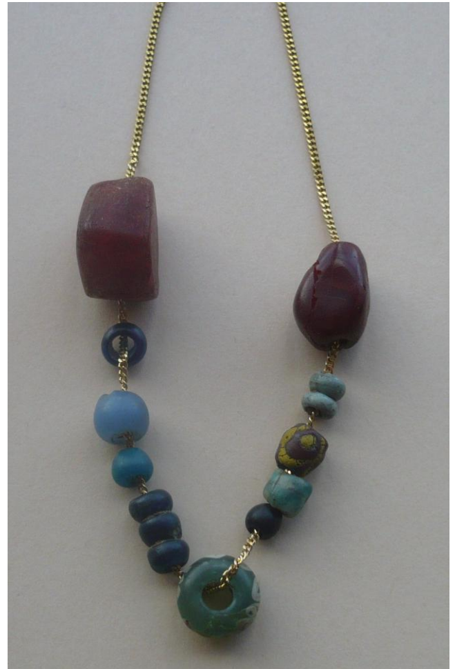
Fig. 3. De kralen, momenteel aan een moderne ketting gerijgd.

De kralen laten geen scherpe datering toe. We kunnen ze slechts plaatsen binnen de algemene chronologie van het grafveld die te situeren valt in de late 6 de eeuw en loopt tot de late 7 de eeuw.