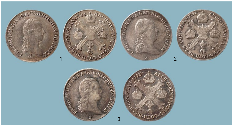
FIG. 6 Voor- en keerzijde van de munten uit Oostenrijk. Jozef II: 1: 1/4 kronenthaler (nr. 10); Leopold II: 2: 1/4 kronenthaler (nr. 16) en Frans II: 3: 1/4 kronenthaler (nr. 17). Obverse and reverse of the Austrian coins. Jozef II: 1: 1/4 kronenthaler (nr. 10); Leopold II: 2: 1/4 kronenthaler (nr. 16) and Frans II: 3: 1/4 kronenthaler (nr. 17).