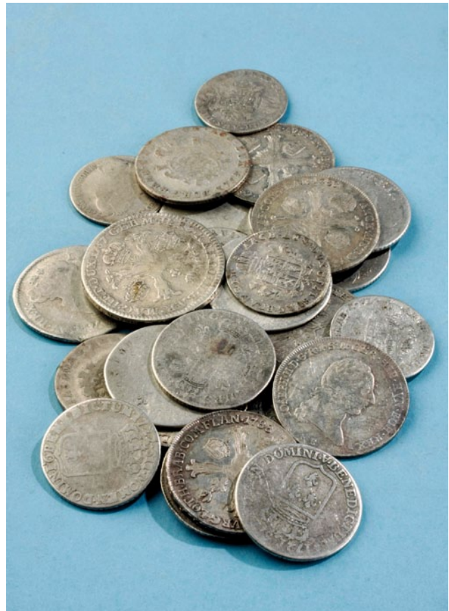
FIG. 1 Muntdepot uit Moorsel. The coin deposit from Moorsel.