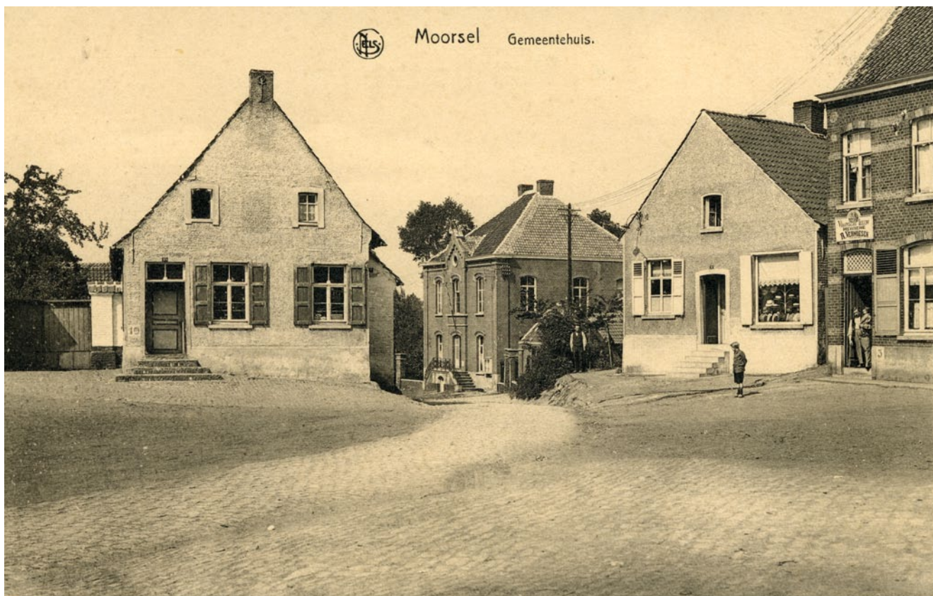
FIG. 4 Foto van de vindplaats ca. 1920, links de inmiddels afgebroken woning. Picture of the find-spot about 1920, on the left the demolished house.

De tweede reeks, met munten uit Oostenrijk, is gelimiteerd tot een looptijd van vijf jaar, namelijk van 1788 tot 1793. Dit blok bevat munten uit de regering van Jozef II (1780-1790), Leopold II (1790-1792) en Frans II (1792-1797).