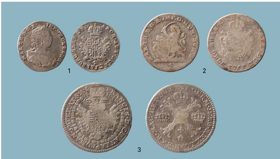
FIG. 5 Voor- en keerzijde van de munten uit de Zuidelijke Nederlanden. Maria-Theresia: 1: 1/8 ducaton (nr. 6); 2: dubbele schelling (nr. 7) en Frans I: 3: halve kroon (nr.9). Obverse and reverse of Austrian coins minted in the Southern Netherlands. Maria-Theresia: 1/8 ducaton (nr. 6); 2: dubbele schelling (nr. 7) and Frans I: halve kroon (nr. 9).