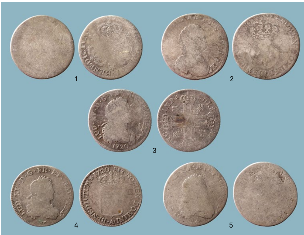
FIG. 7 Voor- en keerzijde van de munten uit Frankrijk. Lodewijk XV. 1: 1/4 écu aux trois couronnes (nr. 18); 2: 1/4 écu vertugadin (nr. 19); 3: Petit Louis d'argent (nr. 20); 4: 1/3 écu de France or silver Louis (nr. 22) en 5: overslag van 1/3 écu de France op Petit Louis d'argent (nr. 29). Obverse and reverse of the coins minted in France. Louis XV. 1: 1/4 écu aux trois couronnes (nr. 18); 2: 1/4 écu vertugadin (nr. 19); 3: Petit Louis d'argent (nr. 20); 4: 1/3 écu de France or silver Louis (nr. 22) en 5: overstruck: 1/3 écu de France on Petit Louis d'argent (nr. 29).