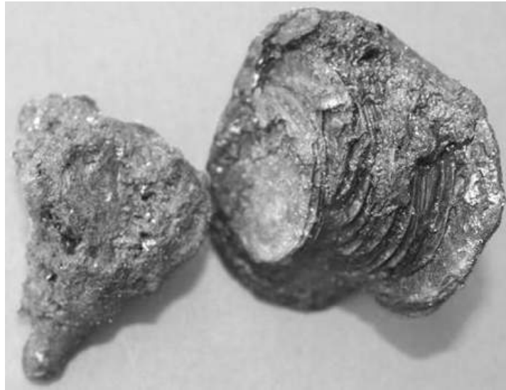
Twee aan elkaar geklitte ensembles uit de Sint-Walburgastraat